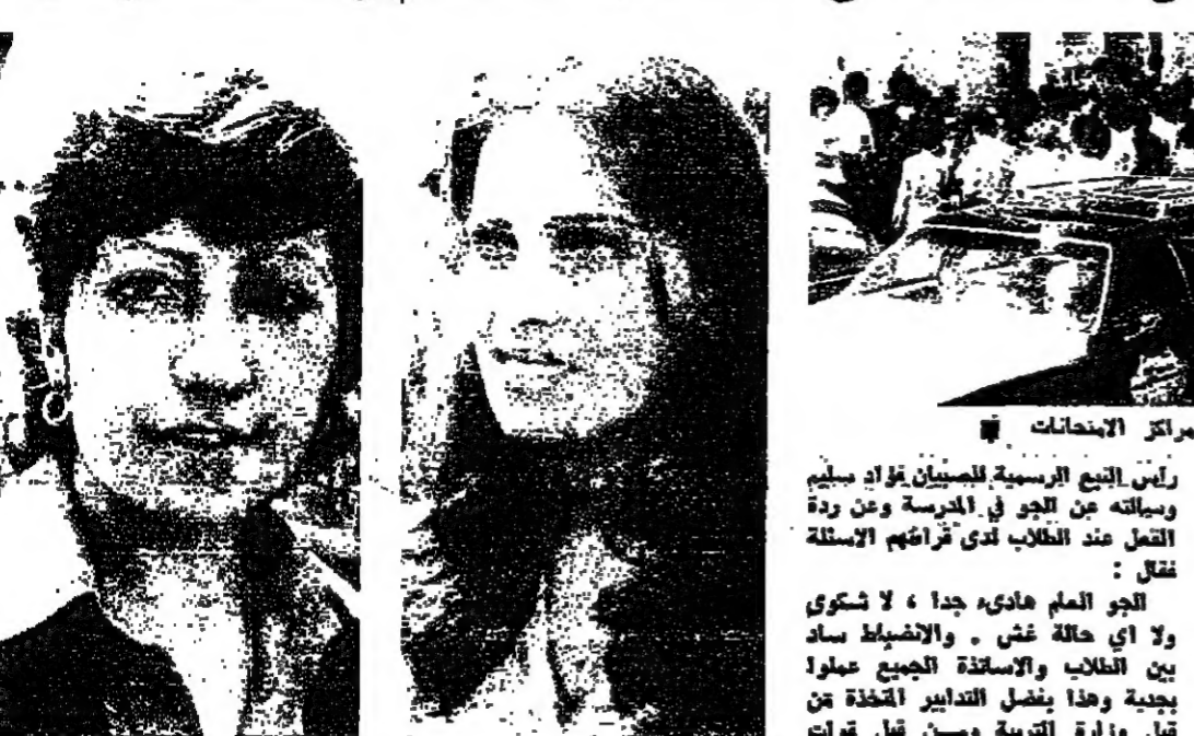
الطلاب أمام احد مراكز الامتحانات

رئيس البعثة الرسمية للبنان في بيروت، وميائله من الجو في المدرسة ومن ردة حالة عند الطلاب لدى قراءتهم الأسئلة فقال: «من حيث الأسئلة أم من حيث المراقبة، وحتى من حيث التدابير الأمنية المشددة».